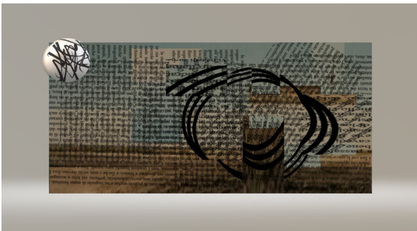
( https://ibb.co/8jcgbDC )